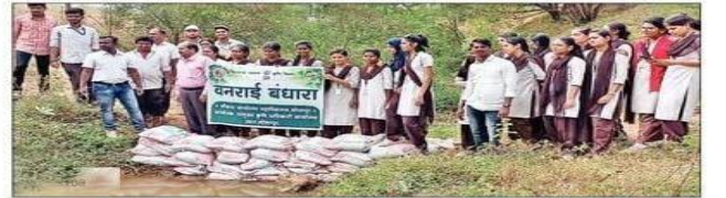
सोलापूर : सोरेगाव येथे वनराई बंधारा बांधताना संगमेश्वर महाविद्यालयाचे विद्यार्थी व कृषी विभागाचे अधिकारी.