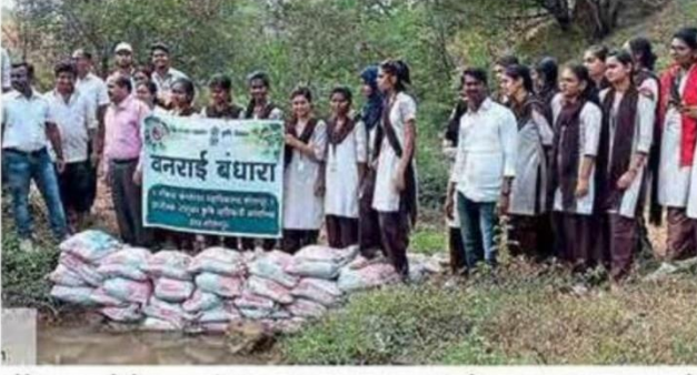
सोरेगाव : येथे वनराई बंधारा साकारताना संगमेश्वर महाविद्यालयाचे विद्यार्थी आणि कृषी विभागाकडील अधिकारी.