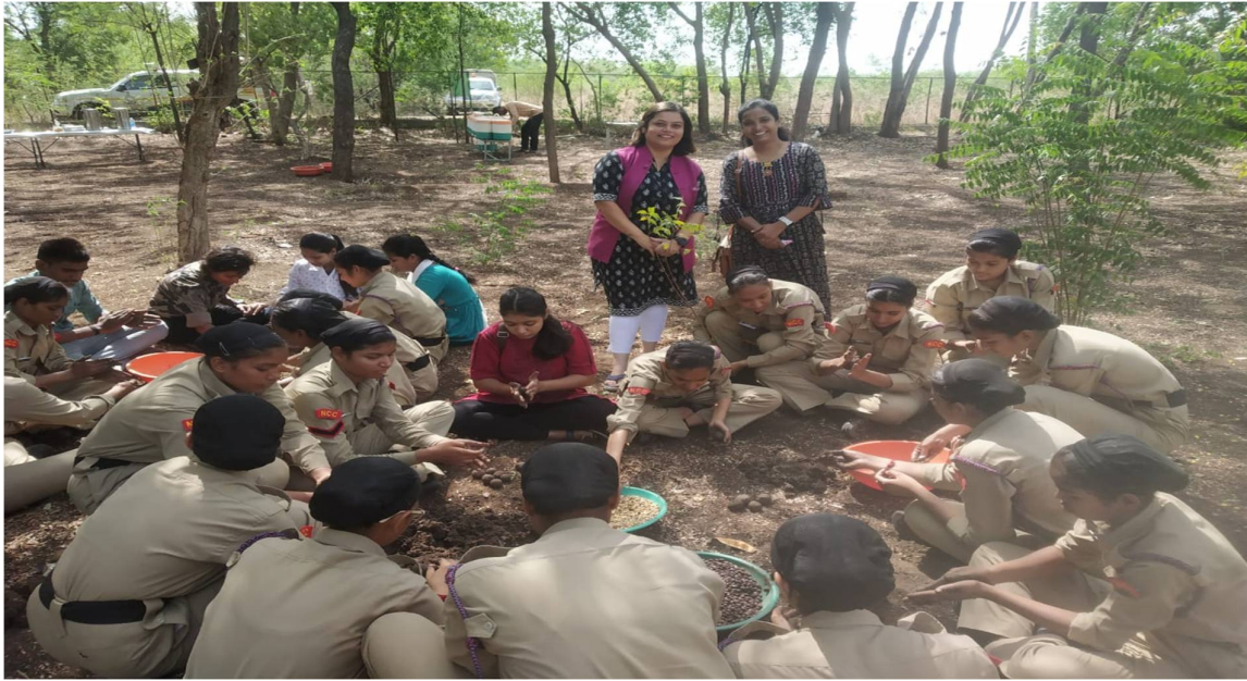
Workshop on making Seed ball