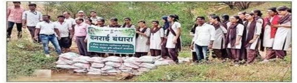
सोलापूर : सोरेगाव येथे वनराई बंधारा बांधताना संगमेश्वर महाविद्यालयाचे विद्यार्थी व कृषी विभागाचे अधिकारी.